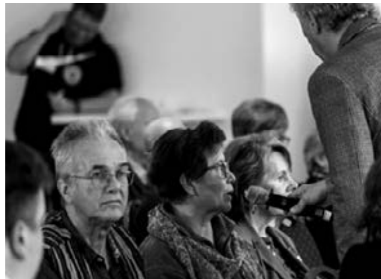
Auch die GVV ist vertreten